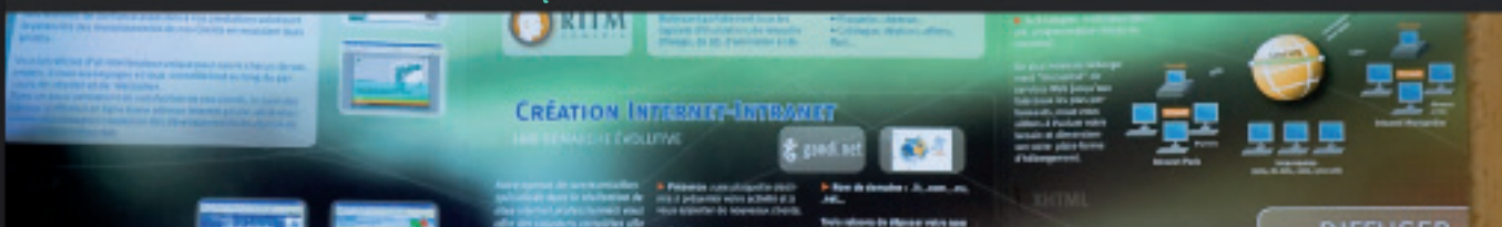
Plaquette institutionnelle > Direction artistique > Exécution > préparation à la fabrication