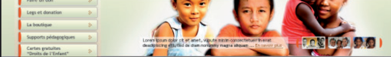
Site internet > Direction artistique