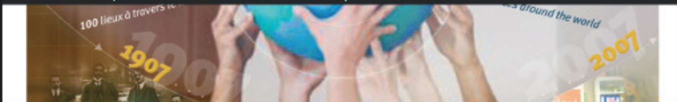
Carte de vœux > Direction artistique