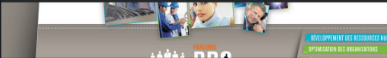
Site internet > Direction artistique