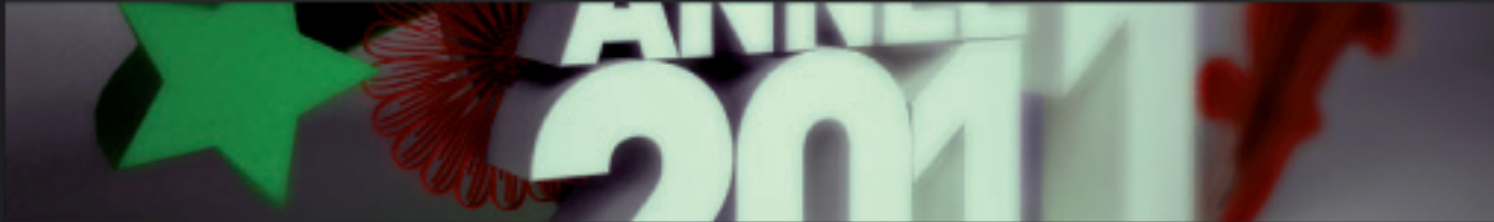
Illustration > Direction artistique > 3D